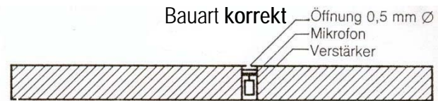
Bauart korrekt Grenzflächenmikrofon (Boundary Layer Microphone) Kein Patentschutz – also frei.

Die Mängel des Mikrontyps "PZM" wurden im AES Preprint 1796 (F-5), May 1981 aufgezeigt: "Über das akustische Verhalten von Druckempfängern, die an schallharten Grenzflächen platziert sind - Überblick und Kritik" von Lipshitz und Vanderkooy, Universität von Waterloo/Ontario (Kanada). Hier folgt als kurzer Auszug das Wichtigste dieses Artikels: