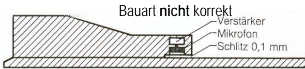
Bauart nicht korrekt Pressure Zone Microphone PZM = Warenzeichen der Firma Crown. Patentrechtlich geschützt.