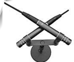
M 300 Klein

Frage: Weshalb sollte für gemischte Stereophonie (Äquivalenz-Stereophonie), wie z. B. ORTF, EBS oder NOS, möglichst eine Mikrofon-Anordnung mit Kleinmembran-Mikrofonen verwendet werden?