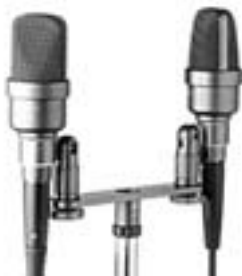
M 930 Groß

Neumann KM 140 Kleinmembran-Mikrofon Niere