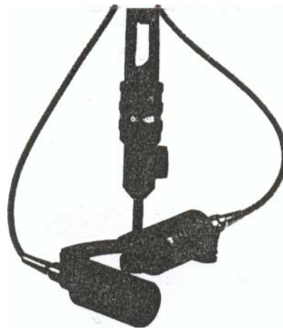
Abb. 9.38 X/Y-Mikrofonanordnung am Beispiel des Neumann KM 140

Ist eigentlich klar, wie sich der Aufnahmebereich ändert, wenn der mit "Öffnungswinkel" bezeichnete Winkel, den die beiden Hauptempfindlichkeitsachsen der beiden Nierenmikrofone miteinander bilden, vergrößert wird? Es ist die Zeichnung ganz unten zu betrachten und man sollte versuchen diese Darstellung zu verstehen.